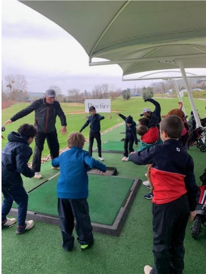
Avec le 1 er regroupement