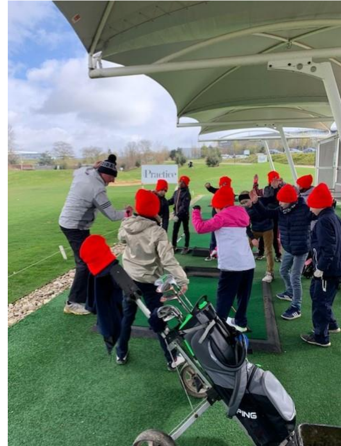
Avec le 2 ème regroupement